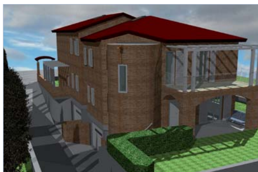
FIGURA 3 Vista laterale dell'edificio in costruzione su cui si è effettuato il confronto