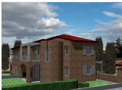
FIGURA 2 Vista laterale dell'edificio in costruzione su cui si è effettuato il confronto